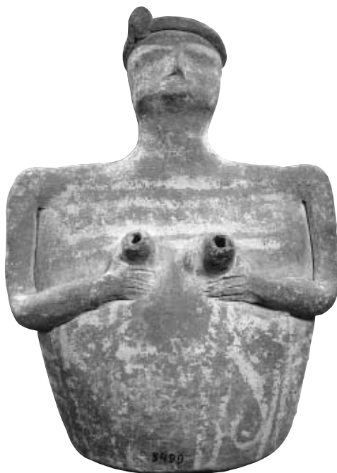
Figura femenina. Mochlos (Grecia). Hacia 2300-2000 a. C.