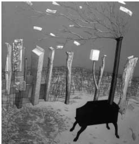
"Carta desde los Lares", de Jorge Zambrano (2000)

■ Doble exposición de pintura figurativa en Pérgamon. Por una parte, Neus Martín Royo presenta "La ciudad de les arts", un conjunto de pequeños formatos sobre los nuevos espacios culturales de Barcelona, como el Auditori o el Teatre Nacional de Catalunya, con el contrapunto