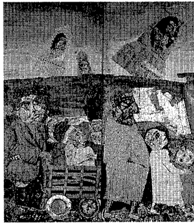
Una obra de Antonio Berni

Son muy representativos de la exposición los óleos y colages de Antonio Berni (1905-1981), protagonizados por Juanito Laguna, un personaje que habita en un paisaje miserable, hecho de basura y de desechos, al que se contraponen, a modo de esperanza, paisajes celestes donde flotan cometas, nubes o cosmonautas. Los aspectos más siniestros de la historia reciente argentina, con sus torturas y "desapa-